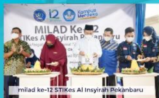
milad ke-12 STIKes Al Insyirah Pekanbaru