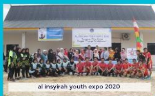
al insyirah youth expo 2020