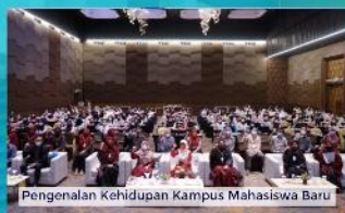
Pengenalan Kehidupan Kampus Mahasiswa Baru