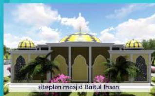
siteplan masjid Baitul Ihsan