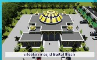
siteplan masjid Baitul Ihsan