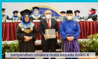
penyerahan cinderamata kepada Ildikti X