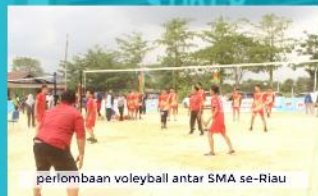
perlombaan voleyball antar SMA se-Riau