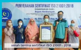
serah terima sertifikat ISO 21001 : 2018