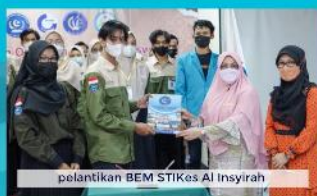
pelantikan BEM STIKes Al Insyirah